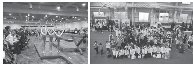
Las Vegas 競技会

※当クラブ所属の選手コースからオリンピック、世界選手権、全日本選手権等に出場し活躍しています。